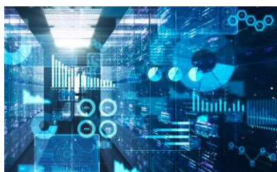
海外への流出が心配

クラウド利用時の懸念点により、レガシー・オンプレミス環境での継続を望み、クラウド移行を躊躇されているお客様に対する新たな選択肢として、Fujitsu クラウドサービス powered by Oracle Alloyをご提案します。