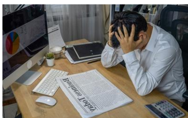
障害対応への不安